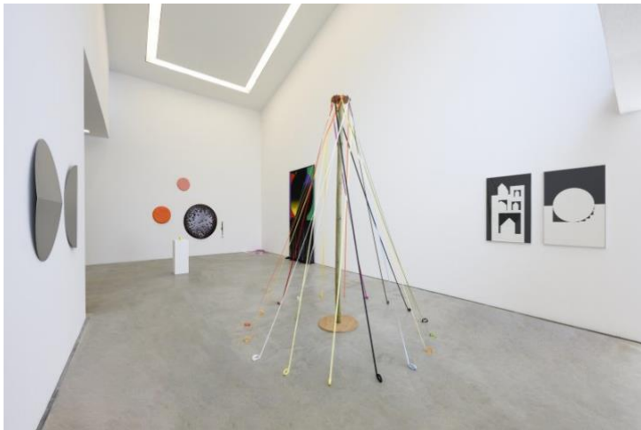
Spirit of Kindergarten – zaaloverzicht

Kindergarten is een avantgardistische leer methode die ontwikkeld is door de Duitse opvoedkundige Friedrich Wilhelm Fröbel (1782-1852). Hij richtte rond 1840 een Kindergarten op; een tuin die de ideale omgeving was voor het kinderspel. De leermiddelen van Fröbel, waarvan een aantal afkomstig uit de collectie van het Nationaal Onderwijsmuseum als vertrekpunt in de tentoonstelling was opgenomen, werden gekenmerkt door het gebruik van vormen en kleuren waaruit de natuur is opgebouwd. Fröbels gedachtegoed en beeld- en vormtaal is sindsdien van grote invloed geweest op kunstenaars, ontwerpers en architecten. Zo refereert architect Frank Lloyd Wright met de opmerking "de esdoorn houten blokken... zitten tot op de dag van vandaag in mijn vingers", rechtstreeks aan Fröbels materialen.