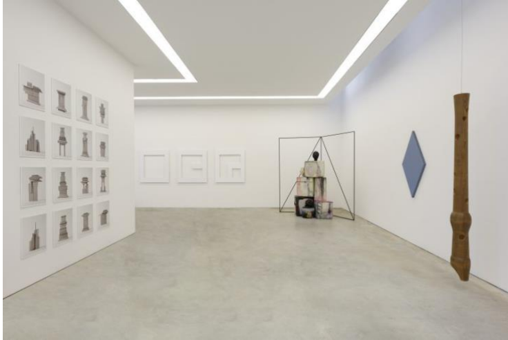
Spirit of Kindergarten – zaaloverzicht

Kindergarten is een avantgardistische leer methode die ontwikkeld is door de Duitse opvoedkundige Friedrich Wilhelm Fröbel (1782-1852). Hij richtte rond 1840 een Kindergarten op; een tuin die de ideale omgeving was voor het kinderspel. De leermiddelen van Fröbel, waarvan een aantal afkomstig uit de collectie van het Nationaal Onderwijsmuseum als vertrekpunt in de tentoonstelling was opgenomen, werden gekenmerkt door het gebruik van vormen en kleuren waaruit de natuur is opgebouwd. Fröbels gedachtegoed en beeld- en vormtaal is sindsdien van grote invloed geweest op kunstenaars, ontwerpers en architecten. Zo refereert architect Frank Lloyd Wright met de opmerking "de esdoorn houten blokken... zitten tot op de dag van vandaag in mijn vingers", rechtstreeks aan Fröbels materialen.