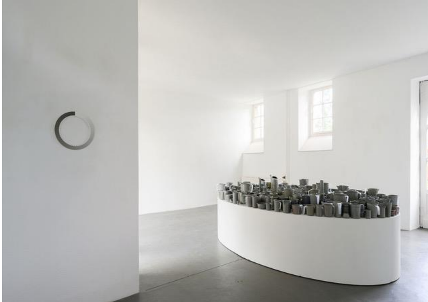
Oscar Lourens – GREY MATTERS

de tentoonstelling in het Koetshuis onderzocht Lourens de tegenstelling tussen duurzaamheid en vergankelijkheid. In zijn wereld van strengheid in maatvoering, schaalmodellen, meters en kubieke centimeters biedt Lourens met zijn werken de mogelijkheid tot nadenken en verwondering.