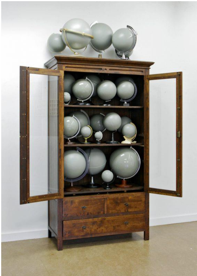
Oscar Lourens – GREY MATTERS

In het Koetshuis presenteerde de Buitenplaats Kasteel Wijlre een solotentoonstelling van kunstenaar Oscar Lourens (1973). 'GREY MATTERS' toonde Lourens' fascinatie voor verzamelingen waarin afmetingen, volume, schaal, vorm, kleur en ruimte centraal staan. Plattegronden, doorsnedes, modellen en data vormen een haast eindeloos archief, dat is gerangschikt in mappen, ordners, kaartenbakken, vitrines en archiefkasten. Lourens spaart als een echte verzamelaar verschillende meetinstrumenten. Door de objecten in grijze grondverf te schilderen zijn ze ontdaan van hun meetfunctie. Tegelijkertijd worden zo de details zoals meetindicaties en typografie echter beter zichtbaar; de objecten verwijzen nog slechts naar het meten als zodanig. De geselecteerde werken tonen vaak een link met het presenteren van natuurhistorische verzamelingen.