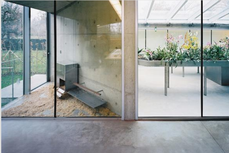
Interieurdetail Hedge House.

De eerste maanden van 2022 kwam er een einde aan de corona-gerelateerde lockdowns en werden stapsgewijs de publieksmaatregelen versoepeld. Hierdoor werd het voor de buitenplaats gemakkelijker om bezoek te ontvangen, hoewel het publiek voor een groot deel van het jaar nog steeds het Hedge House niet kon betreden en alleen in de tuinen en het Koetshuis terecht kon.