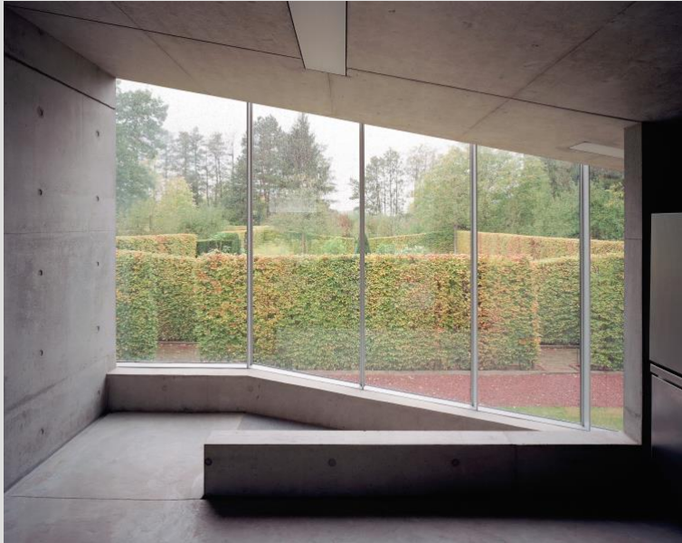
Hedge House en heggen.

Buitenplaats Kasteel Wijlre is een instelling voor hedendaagse kunst en natuur, landelijk gelegen middenin het Zuid-Limburgs Heuvelland. De buitenplaats onderscheidt zich door haar unieke combinatie van hedendaagse kunst, erfgoed en moderne architectuur, verbonden door het groen van haar tuinen, park en het omringende landschap. Naast de gecombineerde natuur- en kunstervaring zijn gastvrijheid, laagdrempeligheid en internationale kwaliteit van de kunstprogrammering belangrijke institutionele waarden. De logische verbinding tussen de specifieke eigenschappen van de plek zelf en het artistiek-inhoudelijke programma geeft buitenplaats Kasteel Wijlre een heldere identiteit en een unieke positionering in de regionale, euregionale en (inter)nationale culturele infrastructuur.