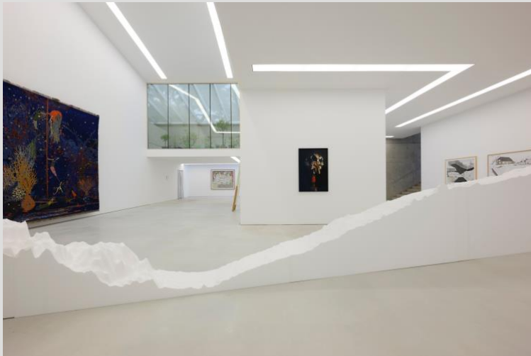
Zaaloverzicht 'Trouble wandering (to eternity)'.

ecologisch bewustzijn te ontwikkelen, op een manier waarbij onze verbeelding wordt geprikkeld, en alternatieve toekomsten worden geschetst?