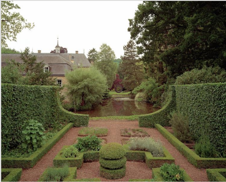
Uitzicht vanuit Kruidentuin op Ad Dekkers' 'Gebroken Cirkel'.

human -idee, waarbij ook de natuurlijke wereld serieus wordt genomen, en agency wordt toegekend.