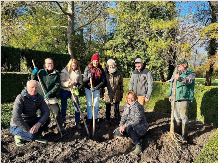
Bomenplant met leden van NTS en de buitenplaats

Op 22 november vond een bijzonder moment plaats: met steun van de Nederlandse Tuinen Stichting, met wie de buitenplaats een warme band onderhoudt, werden de tijdens de watersnood verloren gegane kersenbomen in de boomgaard vervangen. Ondersteund door enkele tuinvrijwilligers en leden van bestuur van de NTS gingen vijf nieuwe, door de NTS geschonken laagstambomen de grond in.