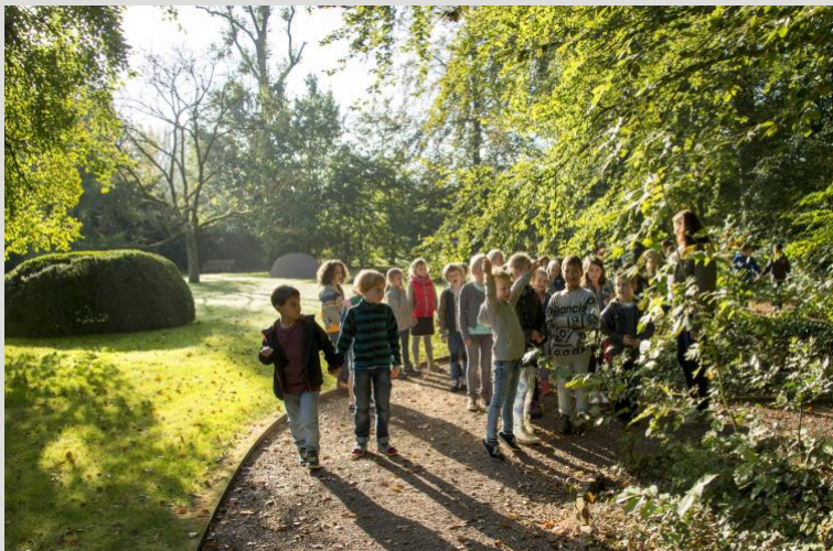
Een basisschool-klas aan de slag op de buitenplaats

Vanaf 2022 is een nieuw en vast onderdeel van het educatieaanbod voor basisscholen ontwikkeld rondom het thema kleur en materiaal. In dit educatieprogramma nemen we het speelse onderzoek als uitgangspunt. Binnen het programma leren kinderen over kleurgebruik in de kunst en de kleur in de natuur. Met kleur creëert men licht en donker, een warm gevoel of koude rillingen. Kleur beïnvloedt stemmingen en roept herinneringen op. Kleur is natuur, gezag, zegen, vreugde, inspiratie, liefde en natuur. Door het kijken naar het werk in de tentoonstellingen en door zelf te experimenteren met kleur worden kinderen uitgedaagd na te denken over de betekenis van kleur in de kunst, de natuur en het alledaagse leven.