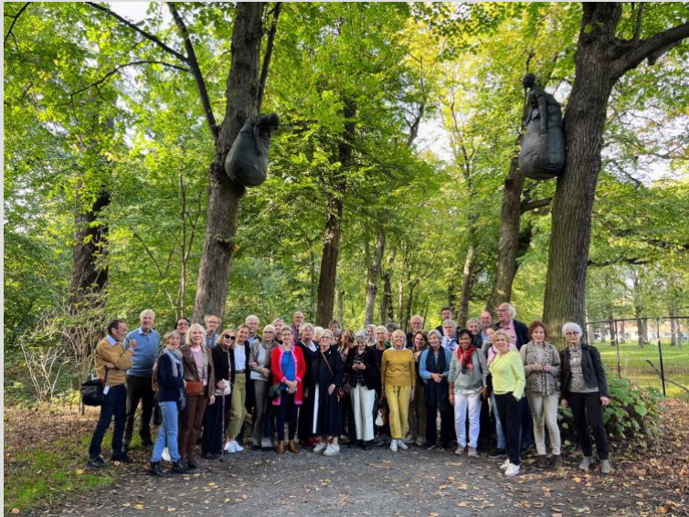
Vrijwilligers en team van buitenplaats Kasteel Wijlre in Middelheim

Op 4 oktober 2022 vond het jaarlijkse uitstapje met alle vrijwilligers en het team plaats. Onder een prachtige najaarszon bracht een touringcar ons naar het Middelheimmuseum in Antwerpen – een park dat net als buitenplaats Kasteel Wijlre kunst en natuur combineert. Onder de deskundige leiding van een aantal rondleiders werd de tentoonstelling Wet Job van Camille Henrot bekeken. De dag werd afgesloten met een gezamenlijk diner in het Heuvelland.