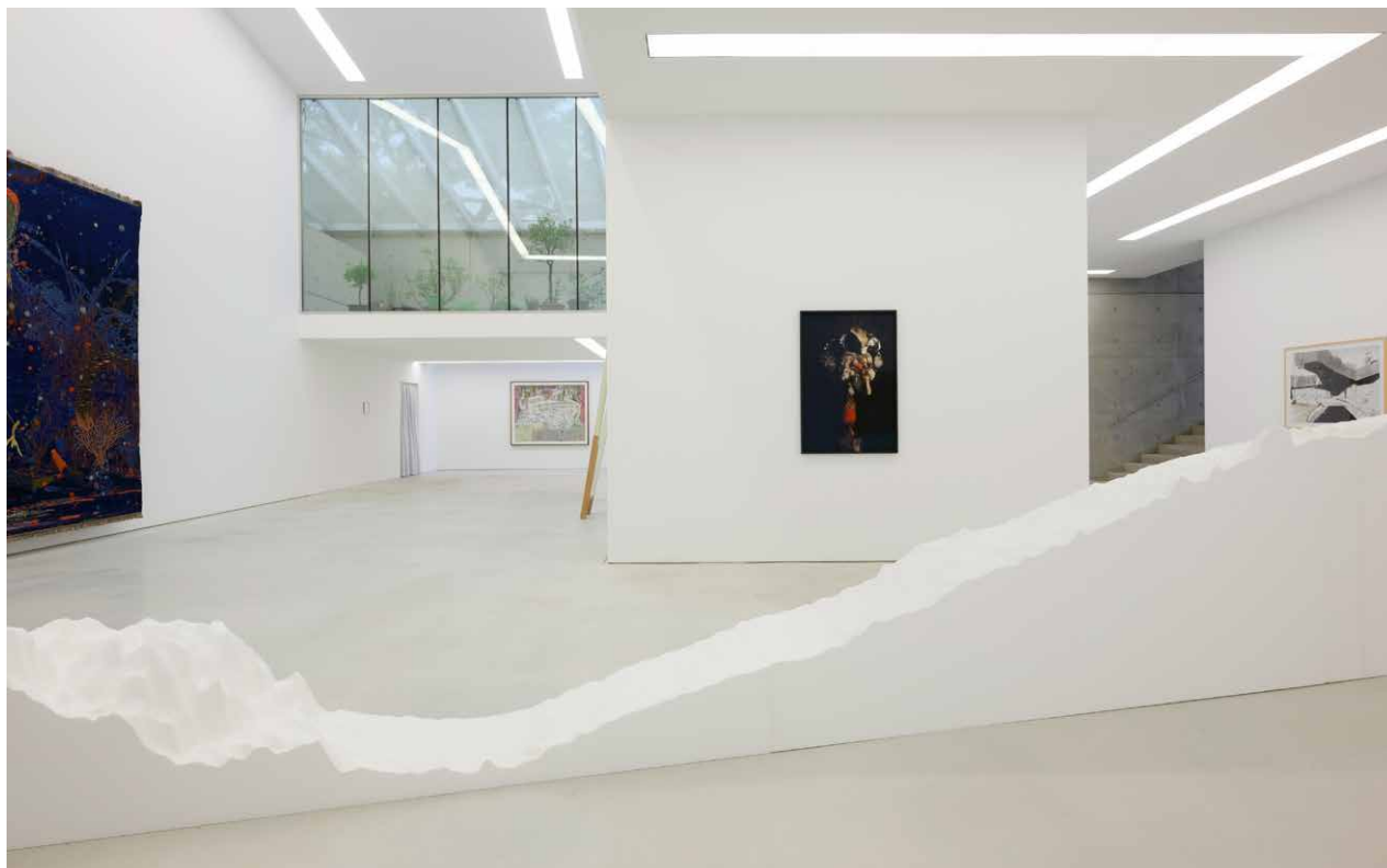
Trouble wandering (to eternity) , zaaloverzicht

Na de watersnoodramp van juli 2021, waarbij de buitenplaats overstromde en het Hedge House zwaar beschadigd raakte, heropende het gerenoveerde kunstpaviljoen in september 2022 met de tentoonstelling 'Trouble wandering (to eternity)', samengesteld door de recent aangetreden directeur Xander Karskens; vanwege de positieve respons van pers en publiek werd eind 2022 besloten de tentoonstelling te verlengen tot 5 mei 2023.