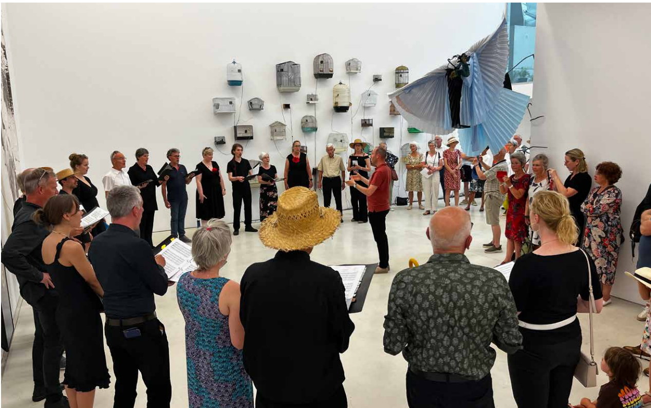
Koorwandeling over de buitenplaats met Lingua e Musica (Maastricht), juli 2023