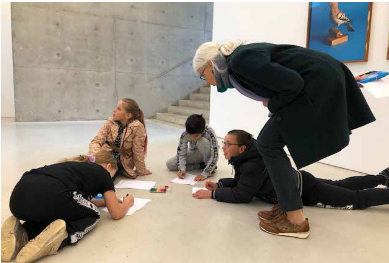
Scholenbezoek aan de tentoonstelling Spark Birds & the Loneliness of Species , mei 2023

Spark Birds & the Loneliness of Species was een internationaal tentoonstellingsproject waarin door de lens van de kunstenaar de relatie tussen vogels en actuele thema's als exotisme, migratie en de neutraliteit van (natuur)wetenschap werden verkend. Het gehele jaarprogramma 2023 stond op buitenplaats Kasteel Wijre (in lijn met het overkoepelende beleidsthema 'mens en natuur') geheel in het teken van de vogel als drager van actuele culturele betekenissen. De tentoonstelling vond plaats in het Hedge House, het Koetshuis en de groene buitenruimte en bracht werk bij elkaar van een internationale, intergenerationele groep kunstenaars: naast een aantal bekendere namen ook jong aanstormend talent. Verbeeldingsvol, kritisch werk van kunstenaars die aan de hand van de vogel verhalen vertellen over de manier waarop de mens zijn positie bepaalt ten opzichte van zijn omgeving. Vragen die aan de orde kwamen waren onder andere: Wat kunnen vogels ons leren over onze eigen identiteit? Hoe verhouden concepten uit de natuurwetenschap als 'exotisme' en 'invasieve soorten' zich tot de bredere werkelijkheid, in een tijd van migratie als gevolg van de effecten van globalisering en klimaatverandering?