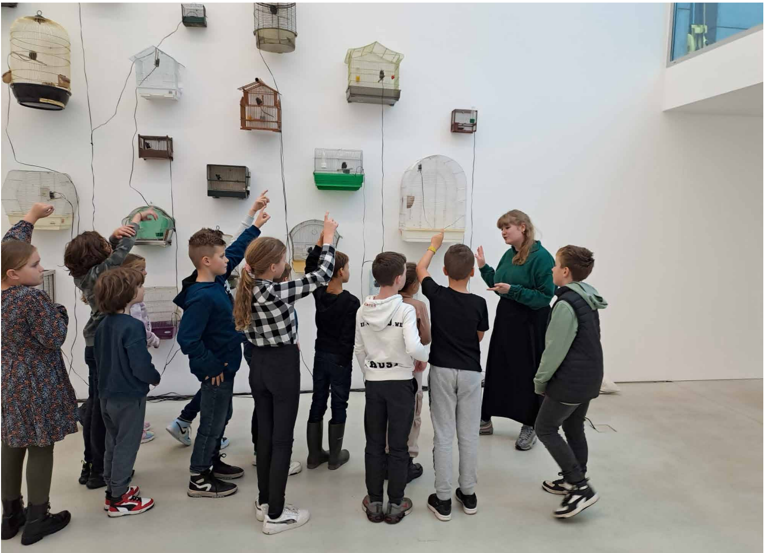
Scholenbezoek aan de tentoonstelling Spark Birds & the Loneliness of Species , mei 2023