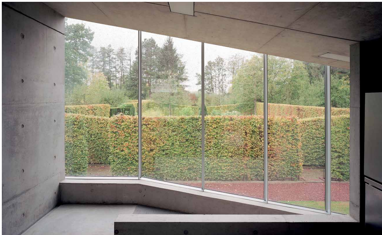
Hedge House

Profiel: Groene oase voor hedendaagse kunst en natuur Buitenplaats Kasteel Wijlre is een instelling voor hedendaagse kunst en natuur, landelijk gelegen middenin het Zuid-Limburgs Heuvelland. De buitenplaats onderscheidt zich door haar unieke combinatie van hedendaagse kunst, erfgoed en moderne architectuur, verbonden door het groen van haar tuinen, park en het omringende landschap. Naast de gecombineerde natuur- en kunstervaring zijn gastvrijheid, laagdrempeligheid en internationale kwaliteit van de kunstprogrammering belangrijke institutionele waarden. De logische verbinding tussen de specifieke eigenschappen van de plek zelf en het artistiek-inhoudelijke programma geeft buitenplaats Kasteel Wijlre een heldere identiteit en een unieke positionering in de regionale, euregionale en (inter)nationale culturele infrastructuur.