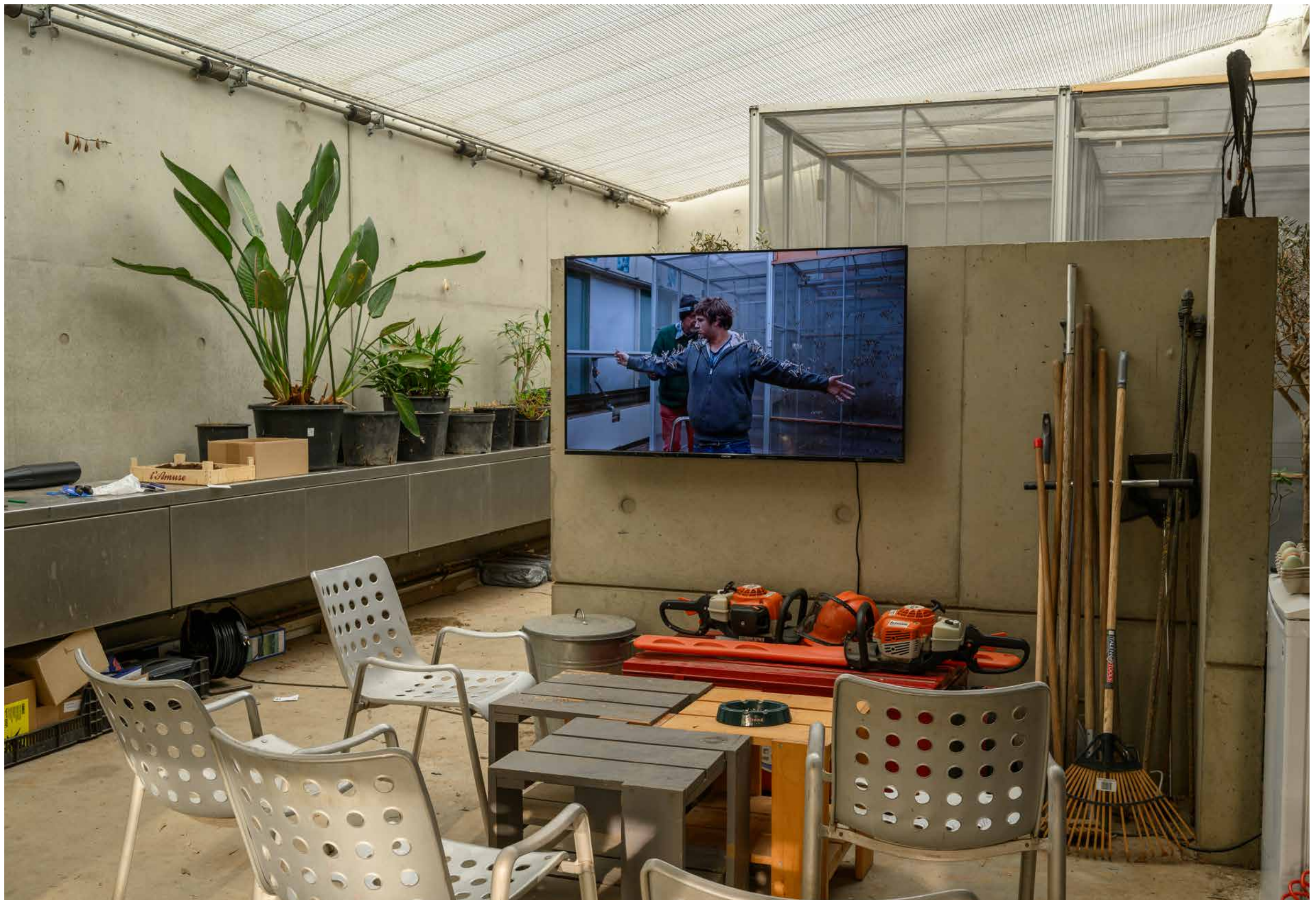
installatie-overzicht · installation overview Catasterism