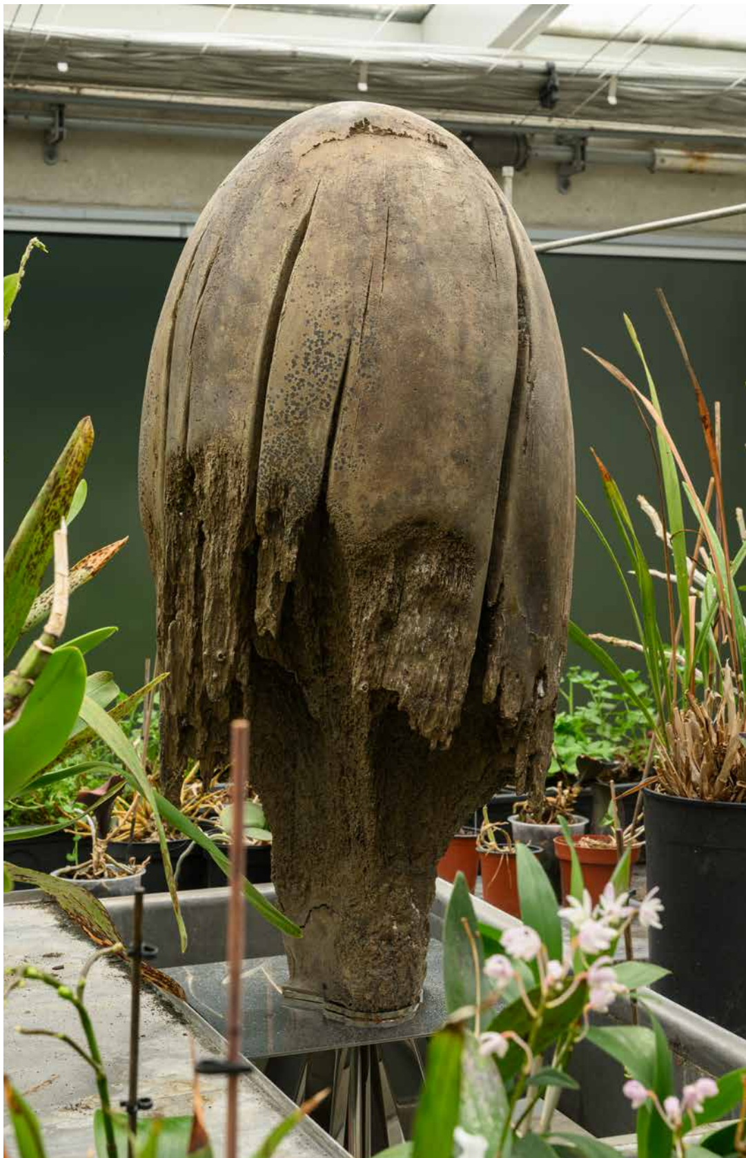
Medusa (A), 2014