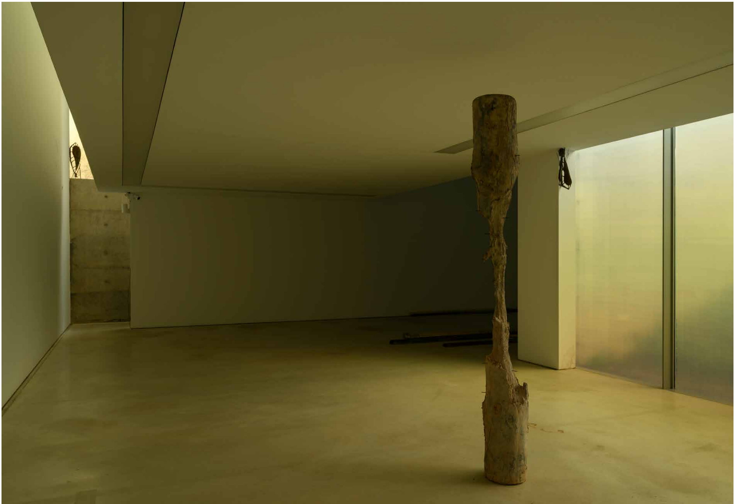
installatie-overzicht · installation overview Catasterism