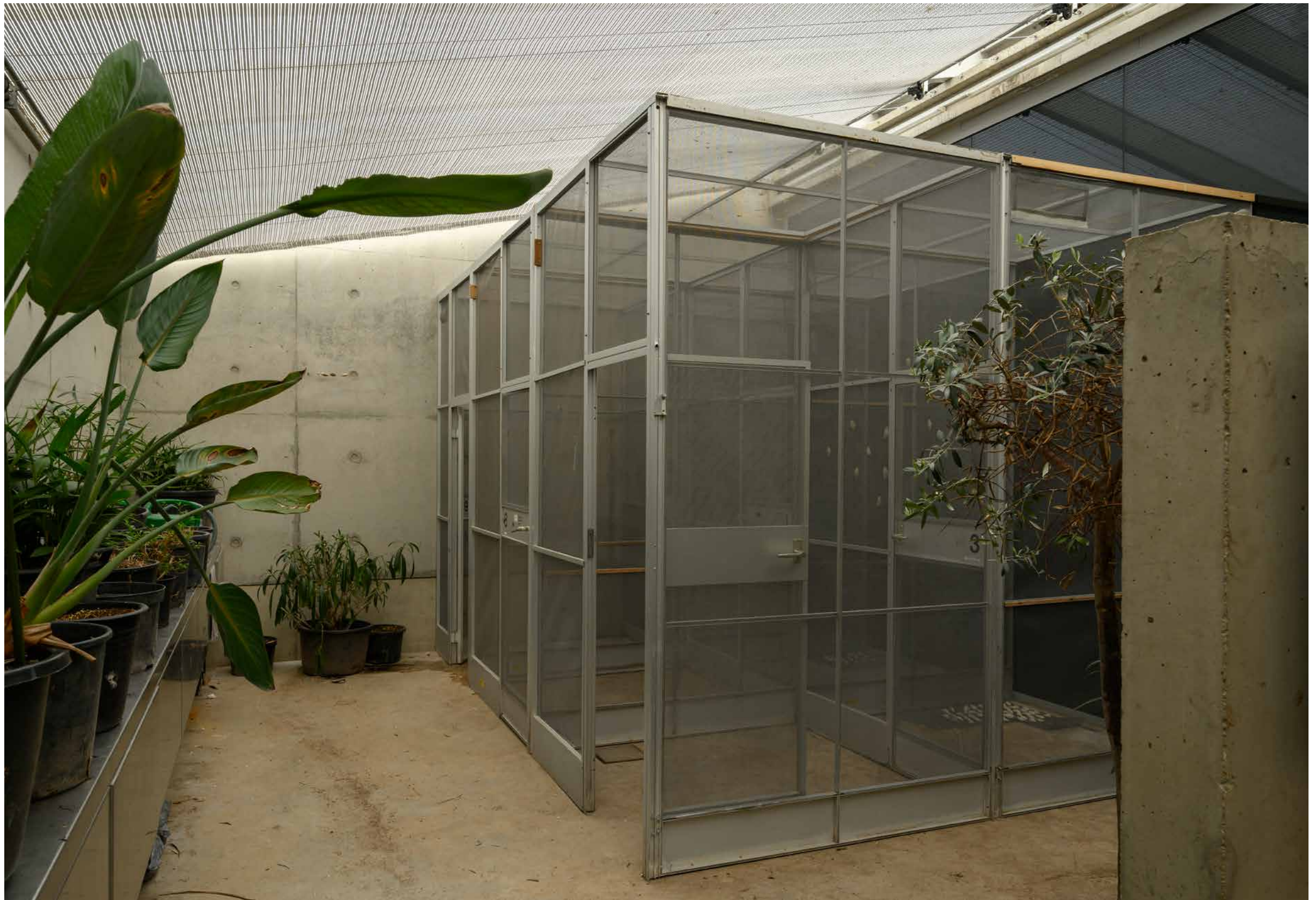
installatie-overzicht · installation overview Catasterism