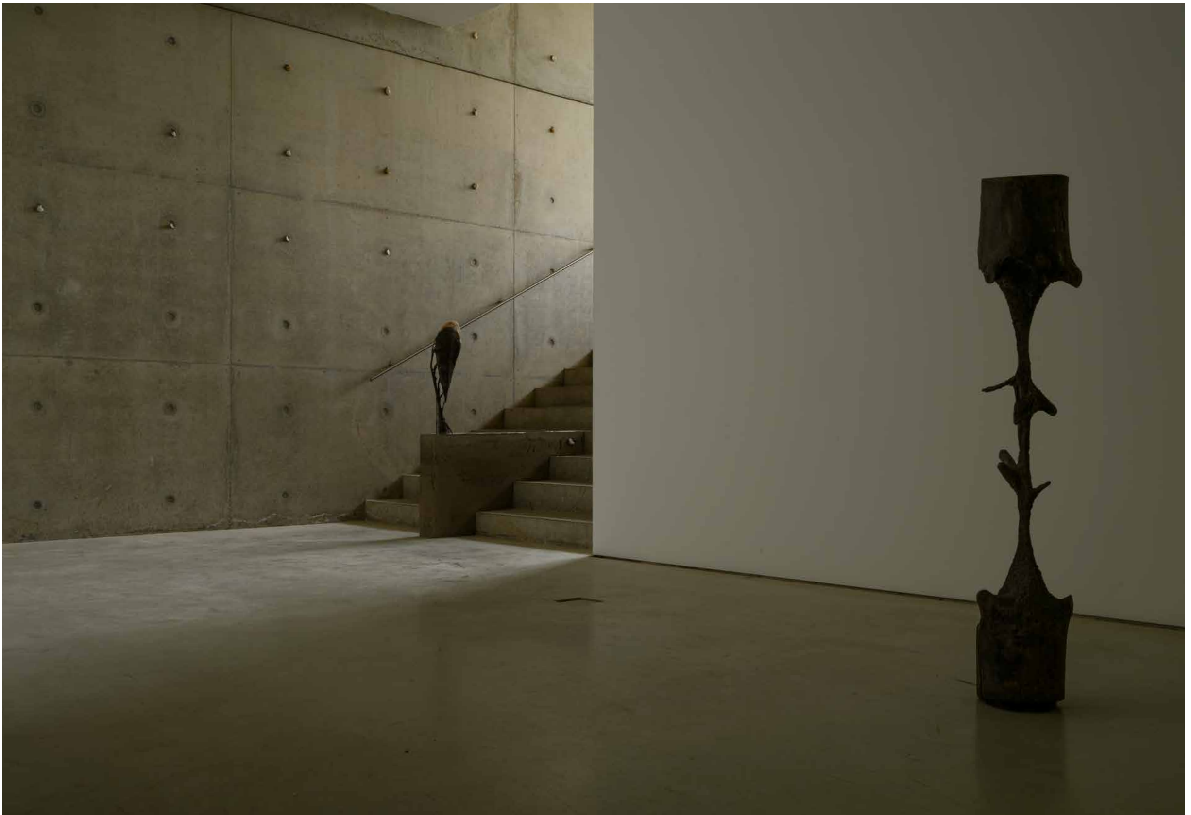
installatie-overzicht · installation overview Catasterism