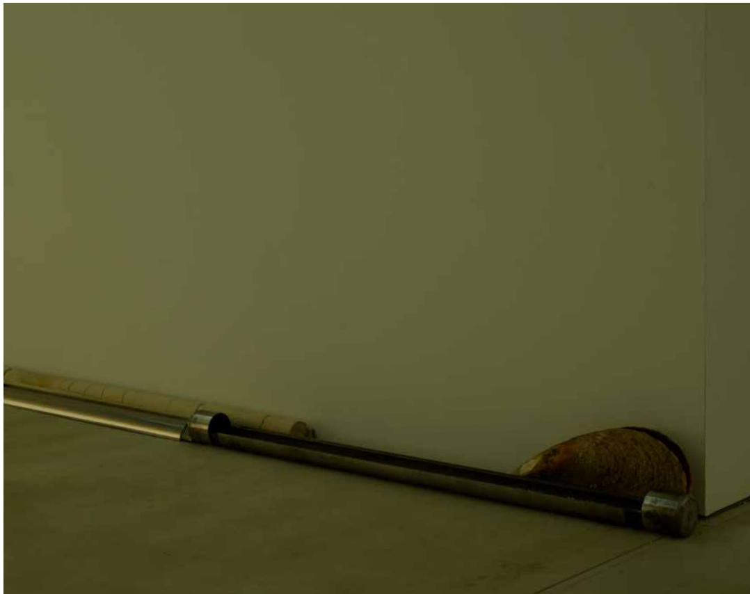
Carotaggio (Venezia), 2014 en · and Carotaggio, 2014-2017