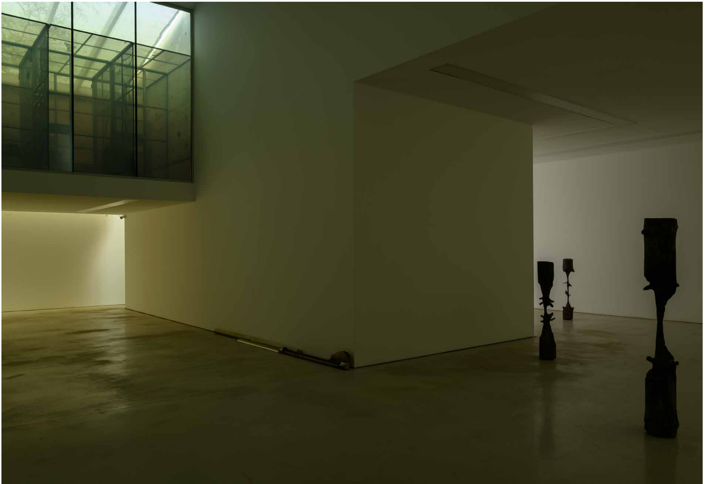
installatie-overzicht · installation overview Catasterism