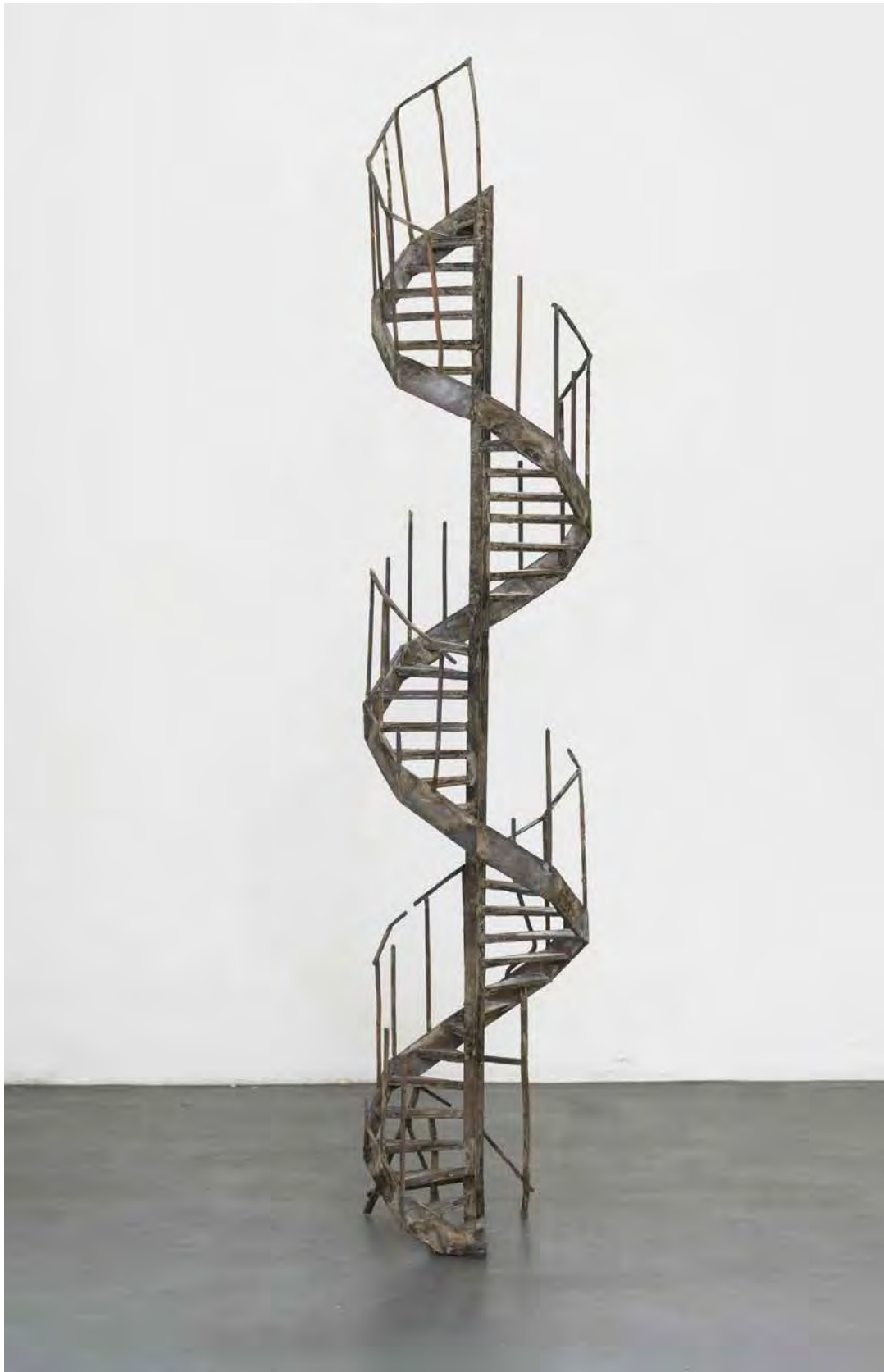
Stairwell (scene 1), 2025