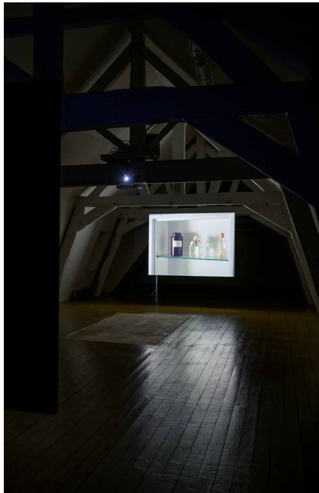
Changing Rooms , 2026