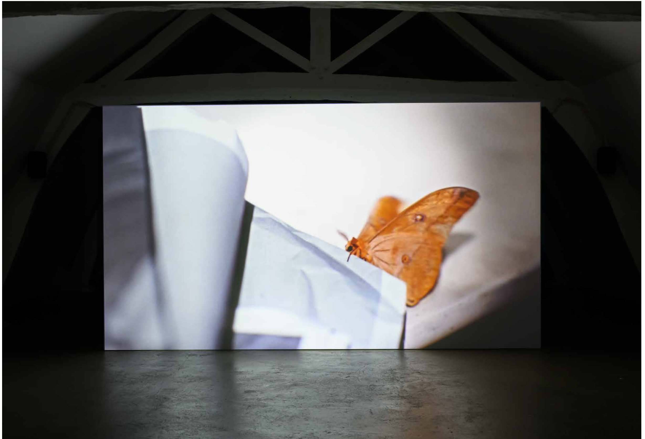
Where I'm Calling From , 2025