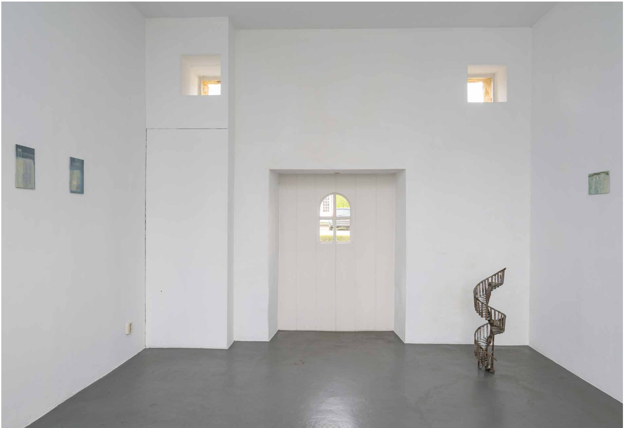
installatie-overzicht · installation overview Changing Rooms