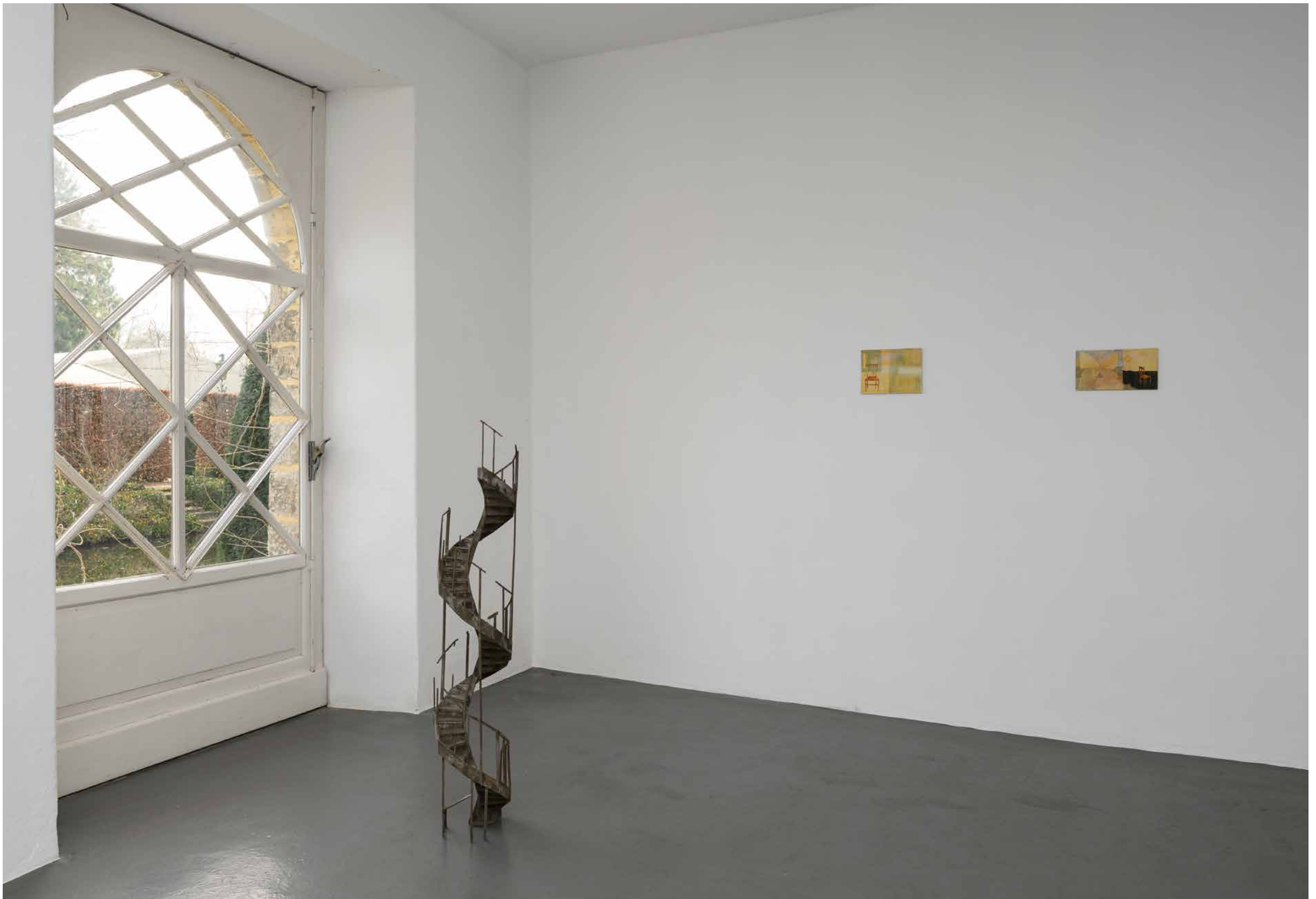
installatie-overzicht · installation overview Changing Rooms