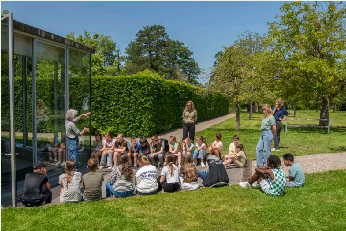
Leven als een beest-sessie