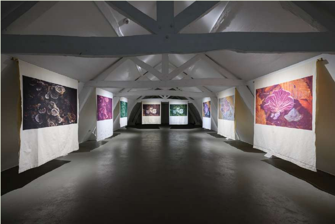
Gladys Zeevaarders - Il y Avait un Jardin, zaaloverzicht

kleed. Het laatste deel van de tentoonstelling was gewijd aan haar kleuronderzoek in de natuur. De tentoonstelling werd geflankeerd door een reeks kleurextractie-workshops van Zeevaarders, waarin kunstenaars en geïnteresseerden kennis konden opdoen in het verzamelen van en werken met natuurlijke pigmenten.