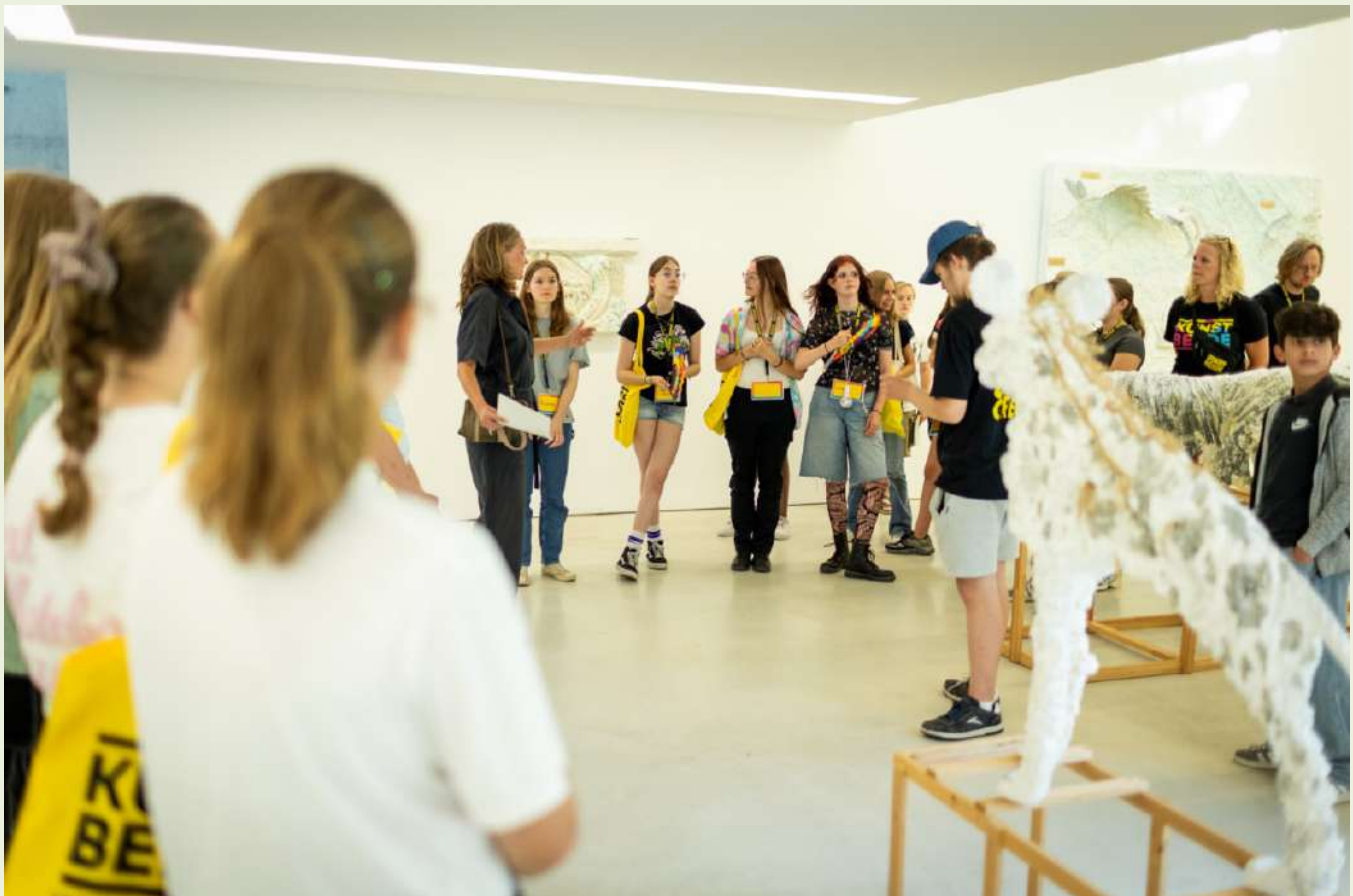
Creators Camp, Kunstbende

Partners: Kunstbende & Gemeente Gulpen-Wittem Bereik 2025: 24 jongeren