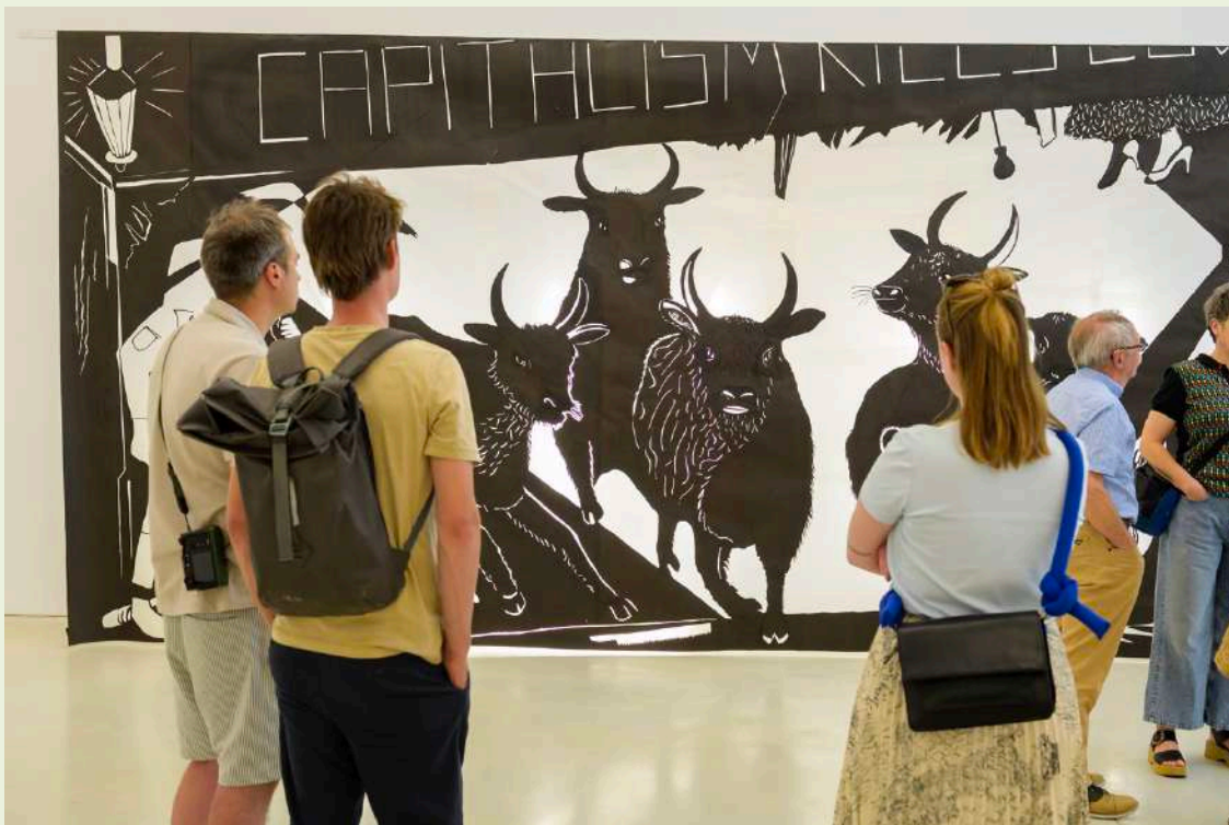
Publiek bij opening Lin May Saeed – The Herd at the Watering Hole

Het publieksonderzoek bevestigt het belang van een lerende aanpak. Door actief te monitoren wie de buitenplaats bezoekt, via welke kanalen bezoekers binnenkomen en welke groepen nog beperkt worden bereikt, ontstaat meer inzicht in toekomstige keuzes rondom programmering, communicatie en publieksverbreding. Het uitvoeren van publieksonderzoek laat daarmee ook zien dat buitenplaats Kasteel Wijlre bewust investeert in publiekscennis en reflectie op het eigen bereik.