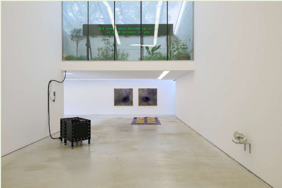
We Live Here Too, zaaloverzicht met werk van Stef Veldhuis, Taqwa Ali en Vibeke Mascini