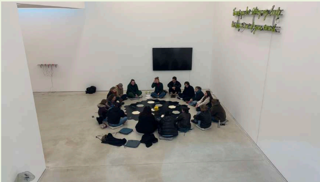
Socratisch gesprek in We Live Here Too , Hedge House

Binnen de residency-pilot kreeg talentontwikkeling vorm, alsmede door de begeleiding van een gastcurator binnen We Live Here Too . De ervaring bevestigde de waarde van dergelijke trajecten, maar maakte ook zichtbaar hoeveel begeleiding nodig is en wat dat betekent voor een kleine organisatie.