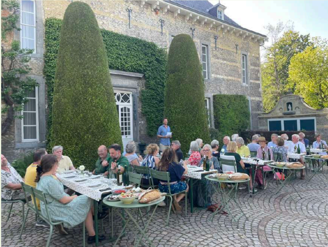
Onderlinge verbondenheid: vrijwilligersdag op de buitenplaats

educatieve activiteiten en vormen daarmee een essentiële pijler onder de werking van de buitenplaats. Tegelijkertijd wordt bewust geïnvesteerd in begeleiding, ontmoeting en inhoudelijke betrokkenheid. Vrijwilligers worden meegenomen in de programmering via rondleidingen door kunstenaars en curator, informatieve bijeenkomsten en gezamenlijke activiteiten, waardoor zij niet alleen ondersteunen, maar zich ook verbonden voelen met de inhoudelijke koers van de buitenplaats. Juist deze combinatie van professionele inzet, flexibiliteit en gemeenschapsvorming maakt veel mogelijk, maar vraagt ook om aandacht voor werkdruk, duurzame inzetbaarheid en organisatorische borging richting de toekomst.