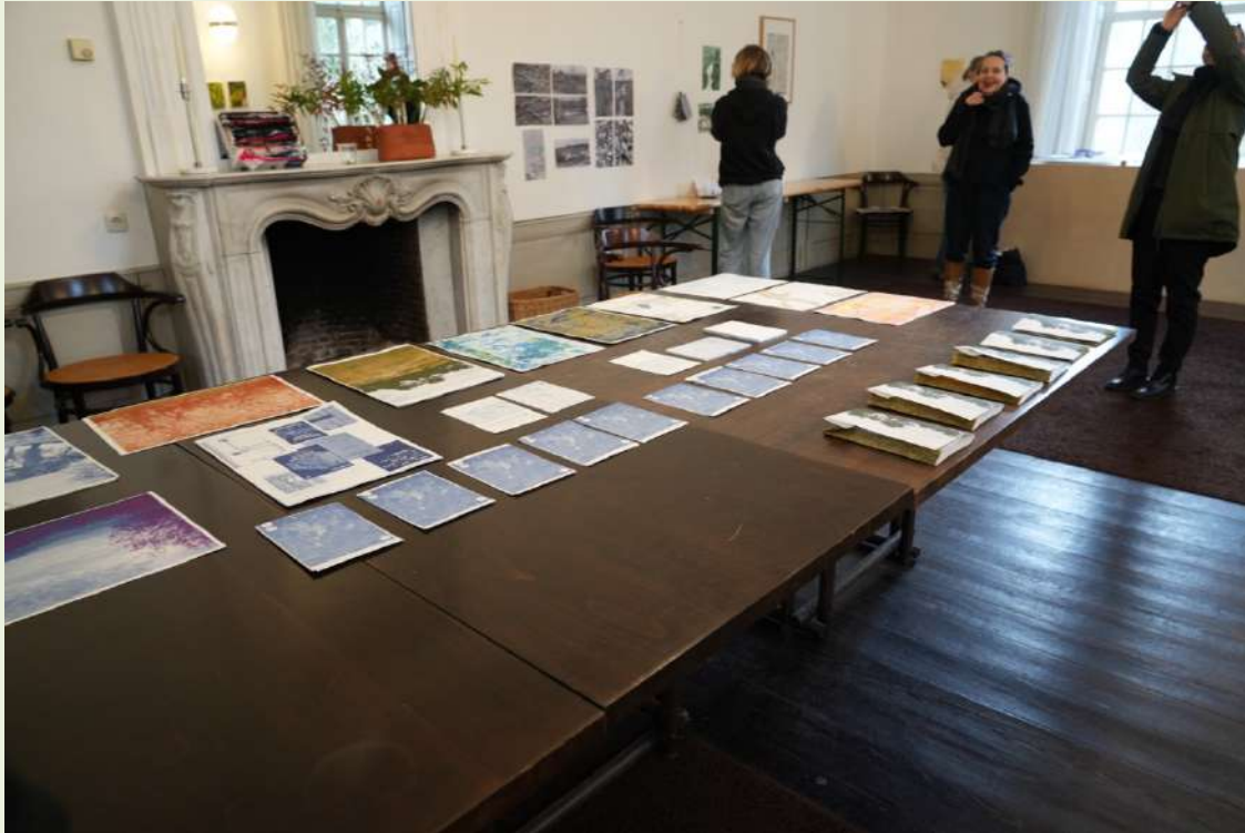
Presentatie studenten PXL MAD Hasselt in het Koetshuis

Met de institutionele partners van Elements werd in 2025 besloten om geen editie van Elements uit te voeren, maar de onderlinge contacten wel warm te houden richting toekomstige continuering. Met Schrit_tmacher Festival in Heerlen werd in 2025 inhoudelijk overleg gevoerd dat uiteindelijk niet tot samenwerking leidde vanwege praktische haalbaarheid; in 2026 is het contact geïntensiveerd en worden er concrete plannen ontwikkeld om de samenwerking te heractiveren en continueren. Met Intro in Situ (Maastricht) werden in 2025 de contouren vastgelegd voor een gezamenlijke residency op de buitenplaats in 2026, gewijd aan het snijvlak tussen kunst en geluid.