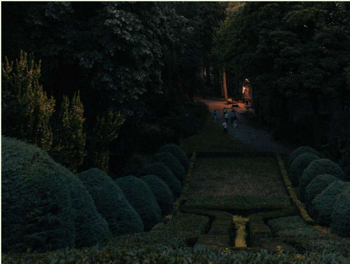
Stiltwandeling tijdens het blauwe uur, Kloostertuin Steyl, 22 juni